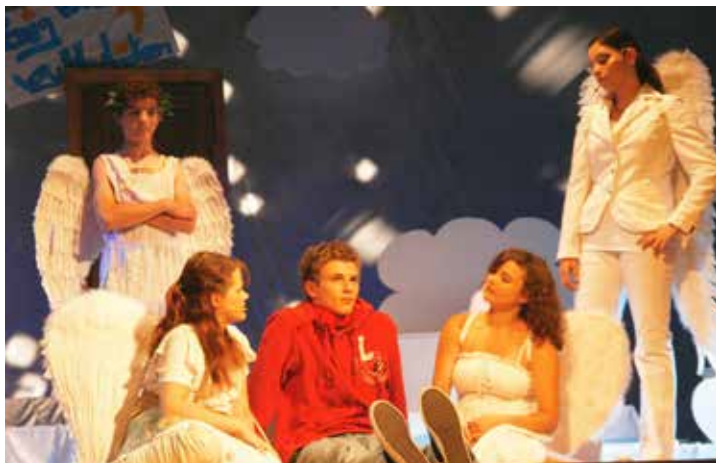
Szene aus „Wilder Panther“