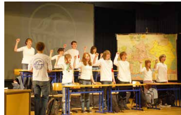
Szene aus „Die Welle“