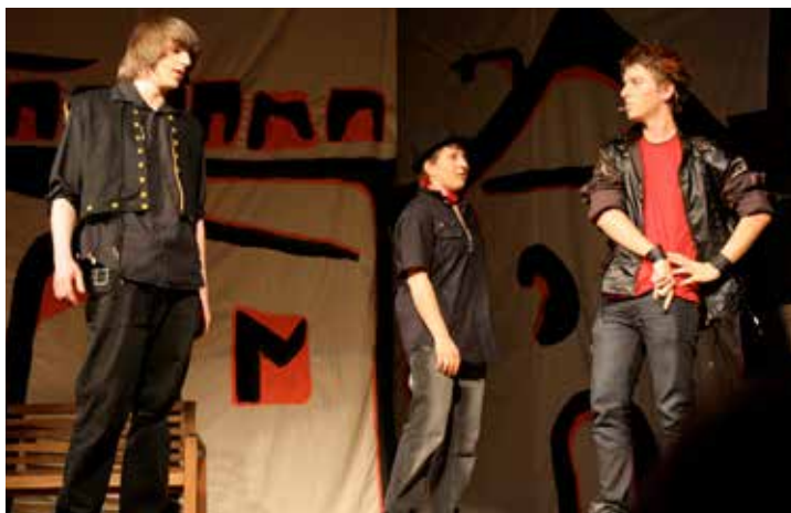
Szene aus „Romeo und Julia“

In „Romeo & Julia“ spielte ich die Rolle des Fürsten. Es war ein tolles Gefühl auch mit einer kleinen Rolle Teil von etwas Großem zu sein. Die Woche vor der Premiere bekamen wir schulfrei, um uns voll auf die bevorstehende Aufführung konzentrieren zu können.